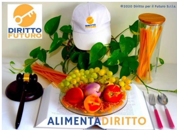
La "Natura viva" a tavola: il Diritto Alimentare con ALIMENTADIRITTO